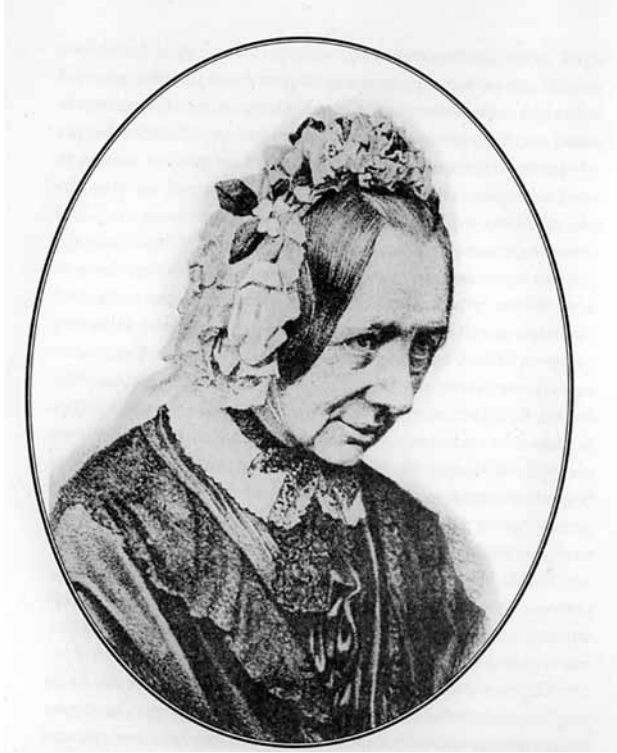
Εικόνα 28 . Fredrika Bremer

υποδομών και υγειονομικής οργάνωσης, την πλημμελή δημόσια υγιεινή, την έλλειψη εκπαιδευμένων ιατρών, τους τοκετούς στα χέρια των πρακτικών μαιών, τα ελάχιστα μέσα πρόληψης, που έχουν όλα άμεσες επιπτώσεις στην υγεία των παιδιών. Συχνές είναι και οι αναφορές σε θέματα έμμεσα σχετιζόμενα με την ψυχική ευεξία τους, 11 την εκπαίδευσή τους, την ανέχεια και την επαιτεία, την παιδική εργασία και την εκμετάλλευσή της, τα έθιμα της Ορθοδοξίας (αυστηρές νηστείες, τρόπος βάπτισης), τις δεισιδαιμονίες και τη λαϊκή θεραπευτική. Οι πιο θλιβερές αναφορές αφορούν στον ασυνήθιστα μεγάλο αριθμό παιδικών κηδειών, ανεξαρτήτως της κοινωνικής τάξης στην οποία ανήκουν.