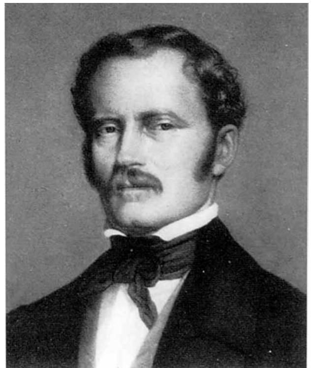
Εικόνα 2α. Ludwig Ross

Ο περιηγητής Edmond About [Εικόνα 2β] καταγράφει τις εντυπώσεις του από το ταξίδι, που πραγματοποίησε το 1852, αναφέροντας μεταξύ άλλων και τα εξής: Η άμιλλα των μανάδων θα έπρεπε να είχε διπλασιάσει σε είκοσι χρόνια τον πληθυσμό του βασιλείου, αλλά οι πυρετοί έβαλαν τάξη στα πράγματα. Το καλοκαίρι τα παιδιά πεθαίνουν σαν τις μύγες. Εκείνα που επιζούν συνήθως έχουν αδύνατα ποδαράκια και την κοιλιά φουσκωτή ως τα 13-14 χρόνια τους. Οι γονείς γλυτώνουν όσα μπορούν. 2 Πράγματι, η οριστική αντιμετώπιση της ελονοσίας (την οποία παραστατικά περιγράφει ο E. About), χρειάστηκε χρόνο και κόπο: εφαρμογή μέτρων σε γενική και τοπική κλίμακα με τη σύσταση «περιπατητικών ή μεταβατικών ιατρείων μετά ιατρού, χειρουργού και φαρμα-