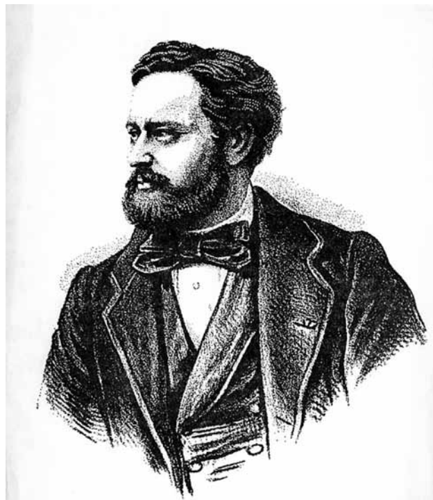
Εικόνα 2β. Edmond About

κοποιού». 3 Επιβεβαιώνεται και η παρατήρησή του για τη θερινή θνησιμότητα: “ήταν πολύ διαδεδομένη η αντίληψη ότι το καλοκαίρι απειλεί την επιβίωση των βρεφών.” Ο Α. Γούδας (πρώτος απόφοιτος της Ιατρικής Σχολής Αθηνών) στις πρώτες στατιστικές και υγιεινολογικές μελέτες,