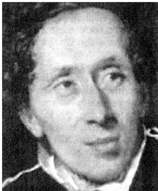
Εικόνα 2γ. Hans Christian Andersen

που έγιναν στη χώρα, θεωρεί το κλίμα της πρωτεύουσας «βρεφοκτόνον», λόγω της υψηλής θνησιμότητας από γαστρεντερίτιδες κατά το θέρος. 4