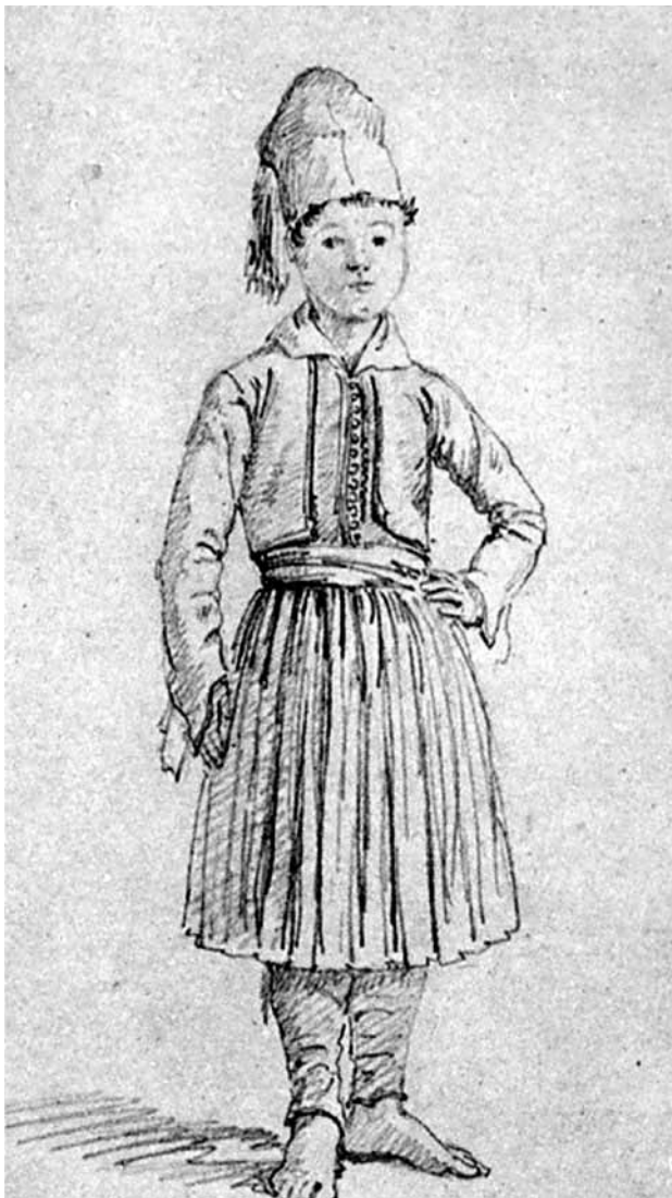
Εικόνα 1. Ελληνόπουλο της Οθωνικής εποχής

Όποιος δεν έζησε αυτή την περίοδο, δεν μπορεί να τη φανταστεί, σε μια χώρα, όπου, ύστερα από βαρβαρότητα αιώνων και έναν δεκάχρονο εθνοαπελευθερωτικό πόλεμο, αρχίζει να γίνεται η πρώτη αρχή ν' αποκαταθεί μία ρυθμισμένη διοίκηση, γράφει ο αρχαιολόγος και ένας από τους πρώτους καθηγητές του Πανεπιστημίου Αθηνών, Ludwig Ross [Εικόνα 2α] σχετικά με την εποχή, που επονομάστηκε Οθωνική από τον πρώτο βασιλιά του νεοελληνικού κράτους, τον Βαυαρό Οθωνα. 1 Στη μικρή Αθήνα του 1834 με τον πληθυσμό των 4000 κατοίκων, ο χαρακτηρισμός της ως «ευρωπαϊκή πρωτεύουσα» με δυσκολία μπορούσε να γίνει αποδεκτός. Η μετάβαση της πόλης από το προεπαναστατικό παρελθόν της στη θέση ενός οικονομικού, διοικητικού, πολιτιστικού και πολιτικού κέντρου ήταν επίπονη και ταραχώδης, καθώς θα αναδειχθεί τόπος συνάντησης ετερογενών στοιχείων. Η νέα κοινωνία, που θα προκύψει, θα χαρακτηρίζεται από βαθιά πολιτισμική ρήξη από ό,τι είχε προϋπάρξει.