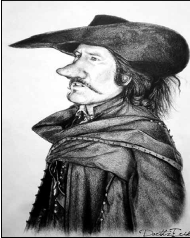
Εικόνα 2. Σιρανό Ντε Μπερζεράκ.

Πρόκειται για μια ταινία, σύγχρονη μεταφορά της κλασικής ρομαντικής κωμωδίας Σιρανό Ντε Μπερζεράκ, όπου ο συμπαθέστατος πυροσβέστης, συναρπαστικός και αντιφατικός, μια πολυσχιδής προσωπικότητα με ικανότητα στο λόγο, λυγίζει μπροστά στον ερώτα για την όμορφη Ρωξάνη (φωτ.2). 1 Θέλει να της ομολογήσει το πάθος του, αλλά φοβάται την απόρριψη λόγω του “μικρού” του προβλήματος ... της τεράστιας μύτης του !