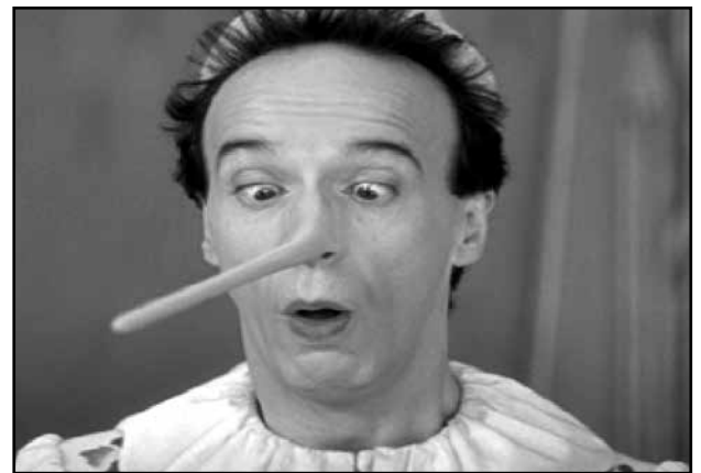
Εικόνα 3. Σιρανό Ντε Μπερζεράκ.

Επίσης στο ιταλικό παραμύθι “ Πινόκιο ” του Κάρλο Κολόντι, ο κεντρικός ήρωας κάθε φορά που έλεγε ψέματα μεγάλωνε η μύτη του. Μια αλληγορική ιστορία όπου η μεγάλη μύτη της ξύλινης κούκλας υποδηλώνει το ψέμα, την υποκρισία και την υπερβολή (φωτ.3) . 2