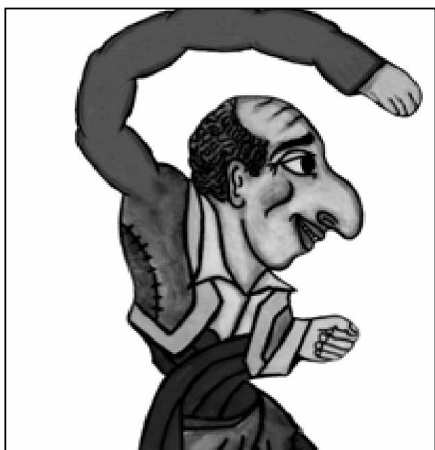
Εικόνα 5. Καραγκιόζης.

Σπουδαίοι κλασικοί καλλιτέχνες στη γλυπτική και τη ζωγραφική έχουν επίσης χρησιμοποιήσει τη μύτη σαν όργανο δημιουργίας και έκφρασης. Για παράδειγμα το κύριο χαρακτηριστικό της αρχαϊκής γλυπτικής ήταν οι