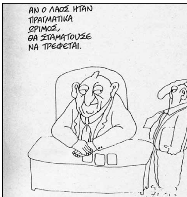
Εικόνα 4. Σκίτσο του Αλτάν.

κριτική στο κεφάλαιο και στις κυβερνήσεις παρουσιάζοντας τους ήρωες του, που είναι οι ίδιοι που κυβερνούν, πάντοτε με μεγάλη πλακουτσωτή, άσχημη μύτη (φωτ.4).