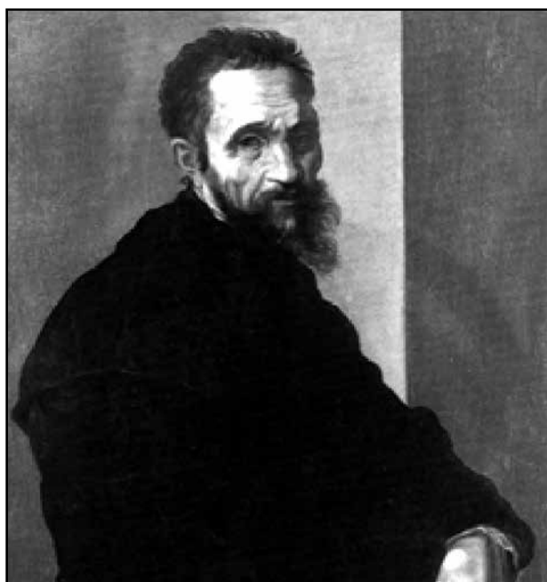
Εικόνα 6. Μιχαήλ Αγγελος . Αυτοπροσωπογραφία.

κούροι με τη μακριά μύτη και το προτεταμένο πηγούνι.