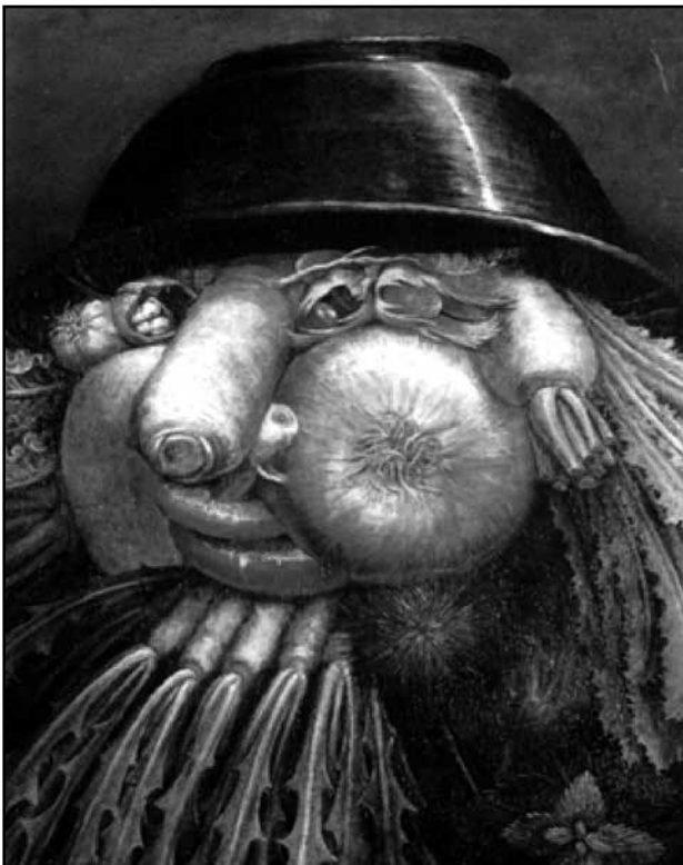
Εικόνα 8. « Ο κηπουρός Λαχανικών » του Τζιουζέπε Αρτσιμπόλντο.

Η ρινοπλαστική λέξη ελληνική από το ρις και το πλάσσειν, είναι η χειρουργική επέμβαση για την επιδιόρθωση ή την αναδιαμόρφωση της μύτης, που γίνεται είτε για αισθητικούς λόγους είτε για να διορθωθεί μια δομική εκ γενετής ανωμαλία ή ανωμαλία που προκλήθηκε από